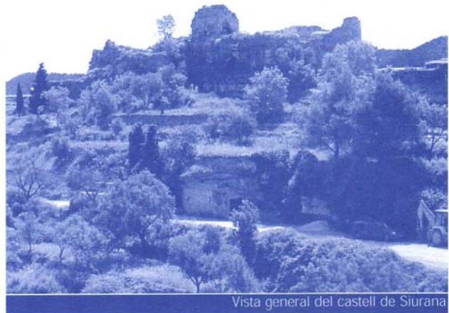
Vista general del castell de Siurana

El castell seria el centre de control del territori i al seu voltant es va desenvolupar una xarxa de defenses, amb torres a la Morera de Montsant, Albarca, Ulldemolins, Prades, Alforja, la Mussara, i l'Albiol. En una segona línia, hi hauria el Vilosell, Vimbodí, la Poble de Cèrvoles, Falset, Pradell de la Teixeta, Cabassers, el