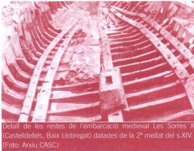
Detall de les restes de l'embarcació medieval Les Sorres X (Castelldefels, Baix Llobregat) datades de la 2ª meitat del s.XIV.

vaixells) enrolament de mariners, drets d'entrada i sortida als ports, dret marítim, documents cartogràfics i portulans, etc., ens permeten intuir una explosió de totes les activitats econòmiques i socials a l'entorn de la navegació. Dissortadament, aquesta enorme presència dels vaixells medievals que es pot intuir, no ens és tant evident a partir de les descobertes arqueològiques subaquàtiques.