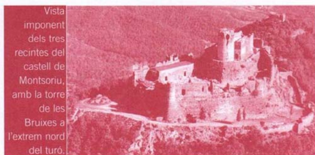
Vista imponent dels tres recintes del castell de Montsoriu, amb la torre de les Bruixes a l'extrem nord del turó.

El castell d'època gòtica, és doncs, un gran clos, o millor dit, tres grans closos emmurallats, que li donen un aspecte de replegament en ell mateix, de tancament en les seves pròpies estructures. De fet en aquest període tingué la funció de refugi i domicili de la família vescomtal, esdevenint el gran castell - palau gòtic residencial.