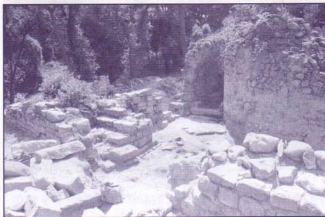
Vista aèria de les estructures identificades com a dipòsits de gra.

Totes aquestes dades referents a les característiques estructurals i arquitectòniques de l'edifici han quedat clarament corroborades a partir de la intervenció arqueològica a l'interior de l'edifici. En aquest sentit, el jaciment presenta una estratigrafia molt simple i alhora extremadament explicativa tant de les característiques que hauria tingut l'edifici com de l'activitat humana i econòmica que s'hi relacionava al llarg dels dos últims segles d'existència. Tantmateix, aquesta especificitat estratigràfica que aporta tanta informació referent als segles XIV-XV no permet identificar ocupacions anteriors, referents als primers segles d'ocupació de la domus (segles XII-XIII).