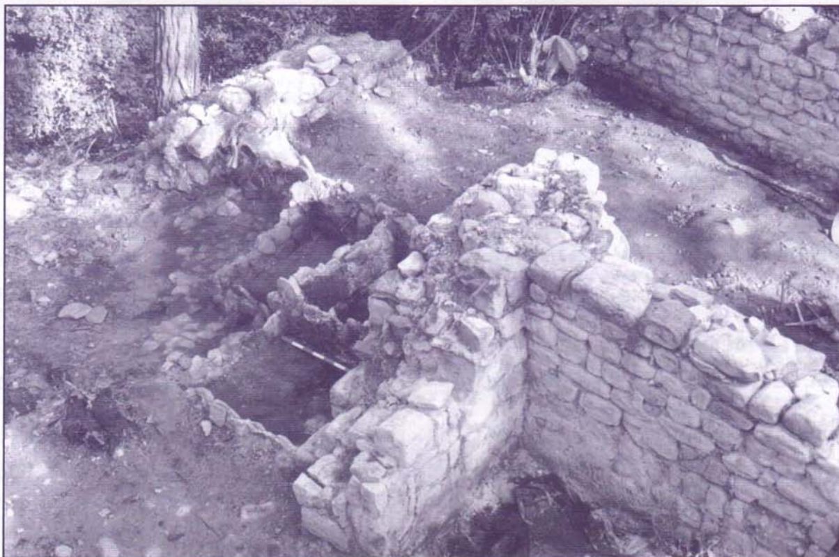
Vista general de l'interior de l'edifici.

Josep Pujades Cavalleria Carme Subiranas Fàbregas Arqueòlegs