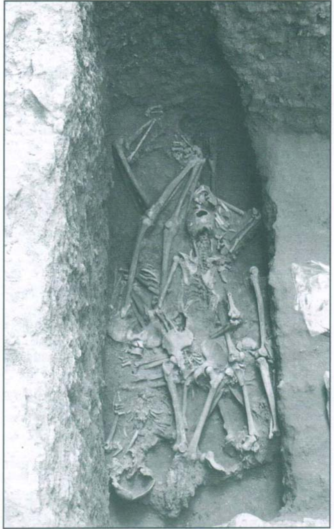
Panteó funerari del segle XIV, amb un enterrament múltiple.

s'han recuperat sens dubte ampliaran qualitativament el patrimoni museístic local.