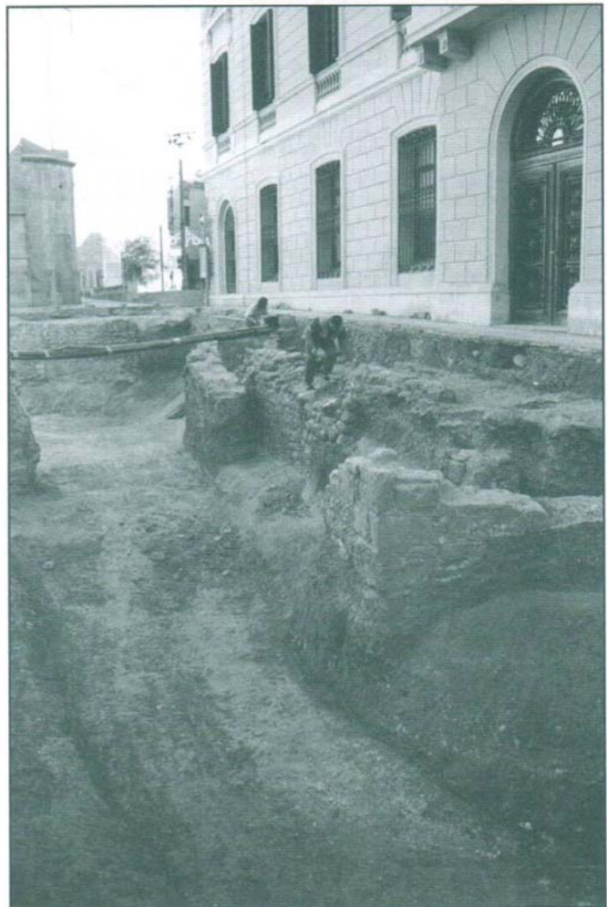
Restes de la muralla i del fossat defensiu del segle XIV (fotografia: Museu d'Història de Sabadell).

La plaça de Sant Roc es localitza al rovell de l'ou de la ciutat, i com a zona de màxima expectativa arqueològica, el projecte de reurbanització de la plaça va incloure la intervenció arqueològica prèvia a les obres. La coordinació dels treballs arqueològics ha anat a càrrec del Museu d'Història de Sabadell (MHS), conjuntament amb el Departament d'Urbanisme i el Departament de Desenvolupament Local, i han estat finançats per l'Ajuntament de Sabadell.