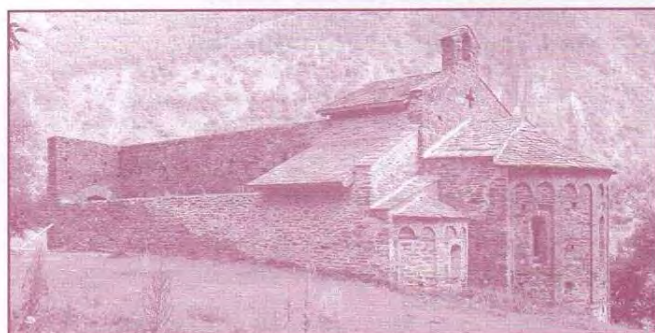
Sant Pere del Bungal Guingueta d'Aneu, Pallars Sobirà.

Finalment, sense oblidar els sempre incòmodes però inevitables condicionants materials, s'ha hagut d'afrontar el fet que el conjunt de peces d'aquesta època, d'origen català i que puguin lluir en una exposició, és més aviat reduït; una circumstància a la que cal afegir-hi que, de les poques peces lluides que hi ha, no totes estan en condicions de ser mogudes. En contraposició, el capítol dels documents i dels materials arqueològics és relativament extens. Però aquest tipus de materials no són, precisament, allò que el públic aprecia més, especialment en un territori tan eixut com el documental (els materials arqueològics són una mica més agraiats). A tots aquests problemes s'hi han d'afegir altres riscos, associats al fet d'haver d'establir un registre divulgatiu en la proposta museogràfica: no es tracta de fer un apardor; ni de fer un parc d'atraccions on la canalla només jugui i no aprengui res, malgrat la presència d'escenografies i elements lúdics.