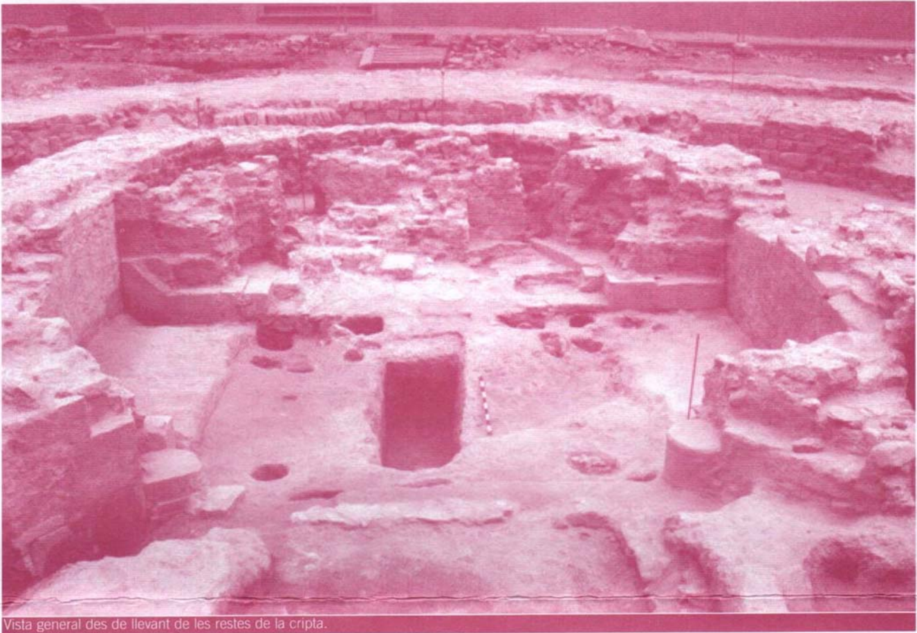
Vista general des de llevant de les restes de la cripta.