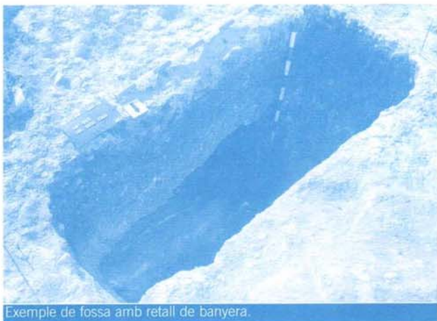
Exemple de fossa amb retall de banyera.

fossa simple amb cavitat lateral, i tombes de fossa trapezoïdal amb caixa de fusta o taüt. Totes les tombes presentaven una orientació Oest-Est.