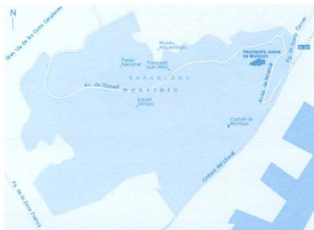
Figura 1. Plànol de situació del cementiri jueu a la muntanya de Montjuïc.

La necròpolis jueva de Barcelona va perdurar a Montjuïc fins a la fi del call de Barcelona el 1391, any dels tràgics successos que es van estendre pel regne de Castella i la Corona d'Aragó, i que van donar lloc a la destrucció d'un gran nombre de calls i a l'assassinat de molts dels seus habitants. Conseqüentment, la comunitat jueva de Barcelona va quasi desaparèixer, deixant el seu cementiri pràcticament descurat, i tots els béns del Call van passar a mans de la corona, degut a que els jueus eren considerats vassalls directes del rei. L'any 1392 la corona va vendre els drets sobre el cementiri vell i nou que els jueus tenien a Montjuïc –amb les pedres, la terra i altres béns– a una societat d'acredors dels jueus per 2.450 florins. Aleshores va començar la devastació del cementiri i l'aprofitament de les seves làpides per a bastir diverses construccions de la pròpia ciutat de Barcelona.