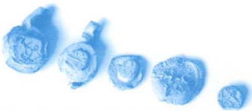
Bolles de drap.

costosa. I és que cal situar-se en l'escenari bèl·lic dibuixat primer per l'anomenada guerra del Vespro i, per tant, les guerres marítimes, i després per la guerra amb Castella, per entendre no només el nou tipus de guerra que s'establirà al llarg del segle XIV sinó també l'elevat cost que aquesta va significar.