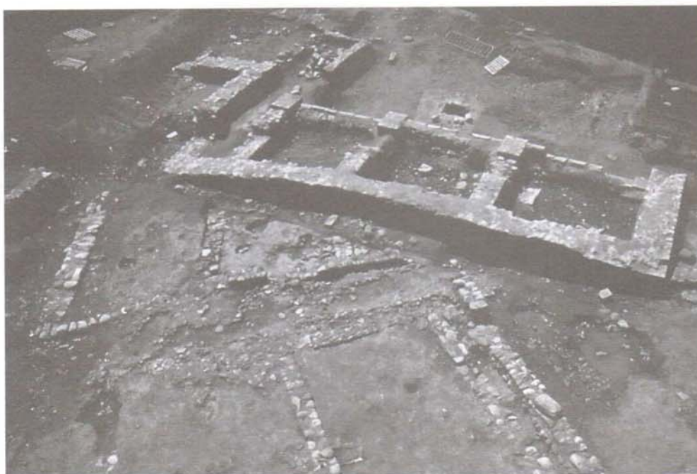
Vista aèria de les restes de la capçalera de l'església del convent de Sant Agustí.

variable, entre 10 cm i 60 cm, i l'amplada, de 45 cm a 60 cm. Atesa la inexistència d'enderroc de pedra, les escadusseres restes de tàpia i fusta cremada apunten un probable aixecament de les parets amb aquests materials. En els casos documentats per l'excavació, la porta s'obria al sud, donant la façana al carrer. El sostre dels pisos seria, probablement, un embigat de fusta i la teulada de la casa, a doble vessant i en materials peribles –i fàcilment combustibles– o potser de pissarra, com mostra alguna troballa puntual. Aquestes cases donen a dos carrers alhora.