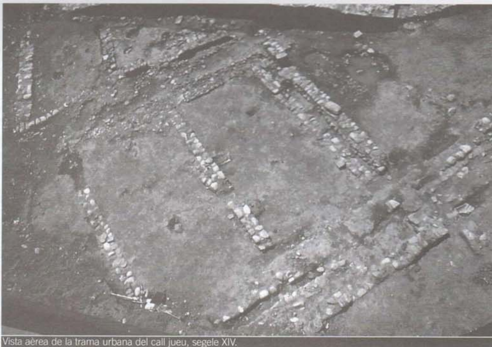
Vista aèria de la trama urbana del call jueu, segle XIV.

Els carrers, empedrats, mostren una orientació est-oest, orientada vers l'estany, i presenten una factura acurada; en un cas, sembla haver estat aixecat per trams per la disposició dels còdols en rengleres. La seva amplada oscil·la entre 3 i 4 m per als més amples i 1.60 m per al menor d'ells. La construcció de tot l'excavat es va fer, sens dubte, en funció d'una planificació urbanística prèvia. Els setze àmbits d'habitació localitzats presenten una planta rectangular. En els casos documentats íntegrament, la seva oscil·la entre els 34m 2 i 17m 2 . Els murs presenten un sòcol fet de còdols de riu lligats amb terra i es fonamentaren en una rasa poc fonda. L'alçada conservada és