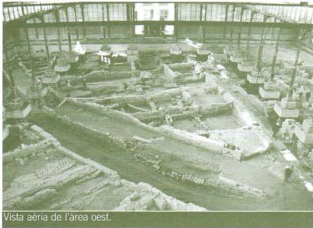
Vista aèria de l'àrea oest.

d'origen gòtic, primer terç del segle XIV, del que es documenten diferents transformacions fins el seu enderrocament l'any 1716.