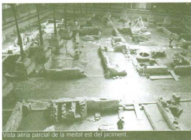
Vista aèria parcial de la meitat est del jaciment.

carrers correspon als propietaris de les cases, fet que provoca que els propietaris només pavimentin segons disposició monetària o ús que fan dels carrers. Igualment, cal dir que no tots els carrers pavimentats disposen de claveguera central, essent els únics el carrers de na Rodés i el Qui va del Born al Pla d'en Llull, mentre que la resta disposen de fosses sèptiques.