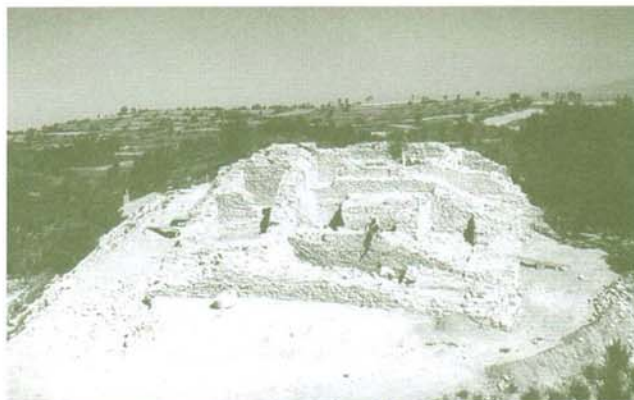
El castell de Castelltallat (Sant Mateu de Bages) durant les tasques d'excavació l'any 2001.

A banda d'aquestes intervencions en edificis religiosos han crescut notablement les actuacions en castells i altres edificis fortificats en els darrers vint anys. Els castells i fortificacions, malgrat éssers bens immobles amb un alt índex de protecció legislativa, tenien el