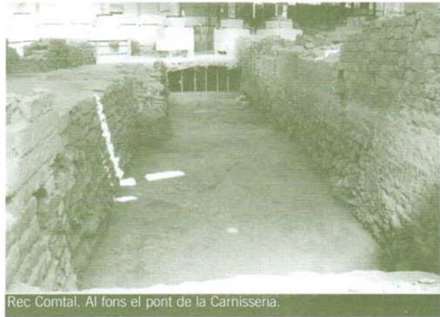
Rec Comtal. Al fons el pont de la Carnisseria.

La tercera illa resta definida pel Rec Comtal i el carrer Qui va del Born al Pla d'en Llull. Destaca en aquest sector de cases la presència del palau Alió i una sèrie de tallers i botigues al nord de l'illa. El palau esmentat és d'origen gòtic i presenta una planta característica, amb un pati distribuïdor i una sèrie d'habitacions i magatzems al seu voltant. Elements a destacar dintre d'aquest palau és l'àrea industrial on s'han documentat quatre grans fogons de cronologia diversa i diferents dipòsits de decantació, així com el propi pati central, perfectament pavimentat amb lloses de pedra i la base de tres pilars que sustentarien