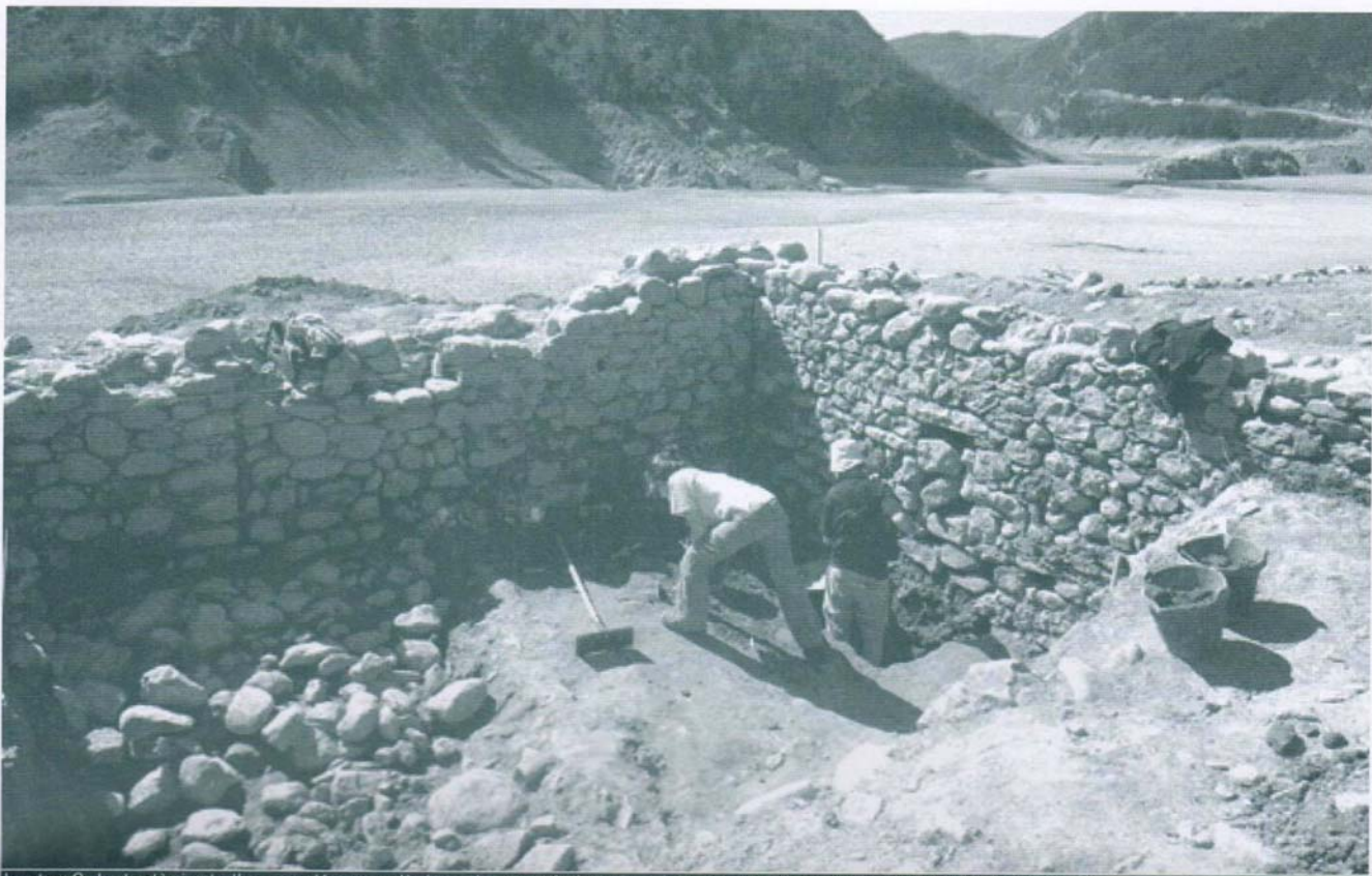
Imatge 2. Instantània de l'excavació arqueològica a la zona de la cuina del monestir.

detectat abundant material arqueològic (ceràmica, vidre, metall i macrofauna) de cronologia moderna i baix medieval que amortitzava el paviment de l'estança. Aquest paviment, el qual sembla haver estat compost de rajoles rectangulars de terra cuita i una gruixuda capa de morter de calç, ha aparegut rebenat per l'enderroc de la part superior dels murs. En últim terme, s'han localitzat fragments d'arrebossat dels murs amb restes de pintura mural junt a la banquetta de fonamentació del mur oest de l'àmbit intervingut.