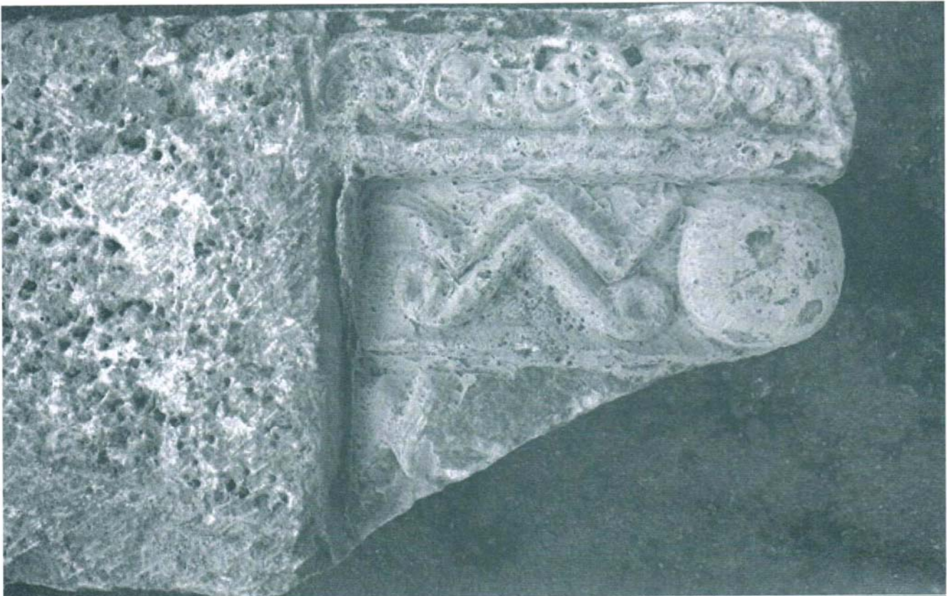
Imatge 4. Detall de la decoració d'una de les impostes trobades a la zona del claustre.

Els resultats de la intervenció arqueològica que hem executat ens porten a concloure que l'envergadura de les restes que encara es conserven del Monestir de Santa Maria de Lavaix és prou important, fent del cenobi un jaciment de grans possibilitats arqueològiques. Les restes arquitectòniques conserven, com hem vist, una alçada aproximada de 3m. L'actuació realitzada també ens ha permès valorar sobre el terreny com afecten les crescudes de l'embassament d'Escales tant al jaciment com als treballs arqueològics.